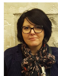
Secrétaire Générale ULGA

les droits des travailleurs le progrès social, la liberté, l'égalité, la justice, la fraternité, la paix, la démocratie et la solidarité internationale.